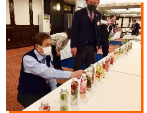
審査員により優秀作品を選びます