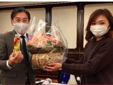
最優秀賞！高田会員