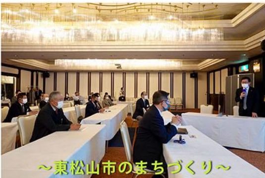
～東松山市のまちづくり～

「住みたい、働きたい、訪れたい、元気と希望に出会えるまち 東松山」の実現に向け、埼玉県とのタイアップによる積極的な企業誘致の成果として税収の増加に加え、雇用と人口の増加も達成しました。