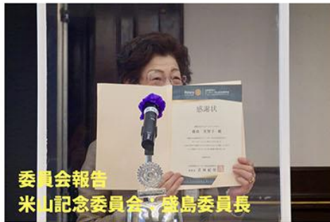
委員会報告 米山記念委員会：盛島委員長